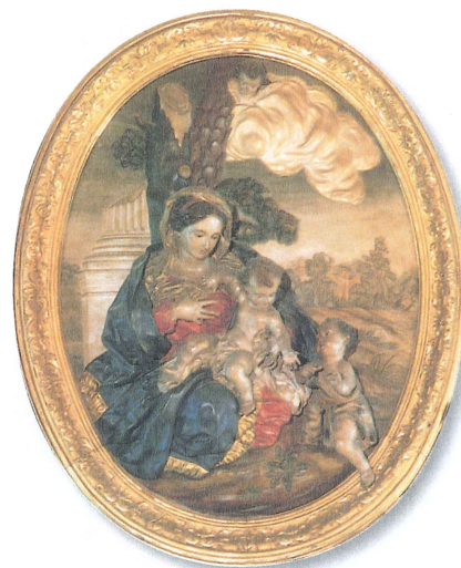
Francisco SALZILLO: La Virgen de la Leche . La obra de SALZILLO es un cruce de estilos que se produce al mezclar la influencia de su padre, escultor italiano, y la tradición española.